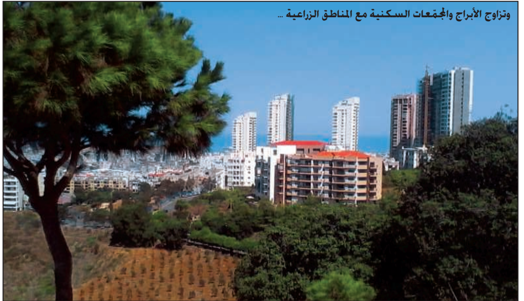
وتزاوج الأبراج والمجمّعات السكنية مع المناطق الزراعية ...