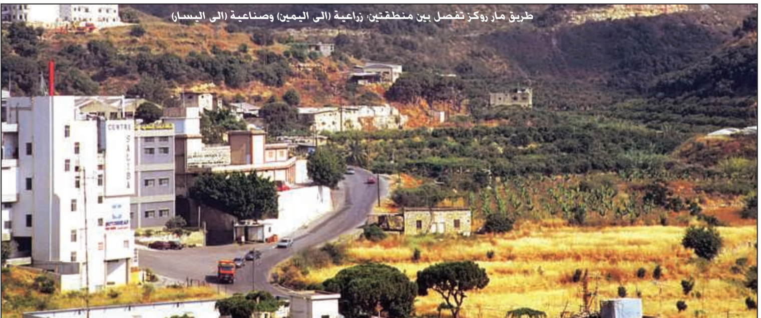
طريق مار روكز تفصل بين منطقتين: زراعية (الى اليمين) وصناعية (الى اليسار)

منطقتين متلاصقتين إحداها زراعية والأخرى صناعية