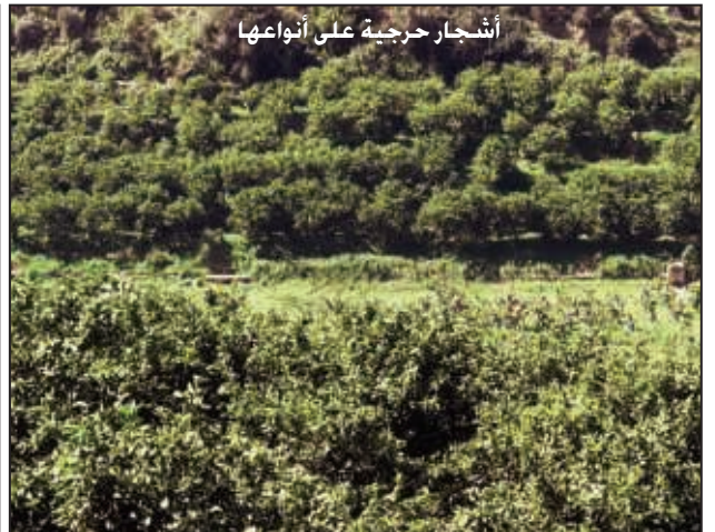
أشجار حرجية على أنواعها