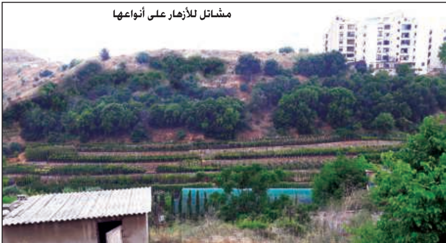
مشاتل للأزهار على أنواعها