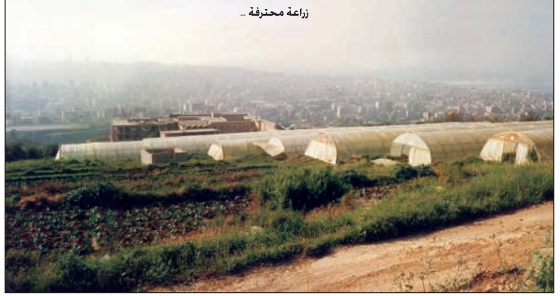
زراعة محترفة ...