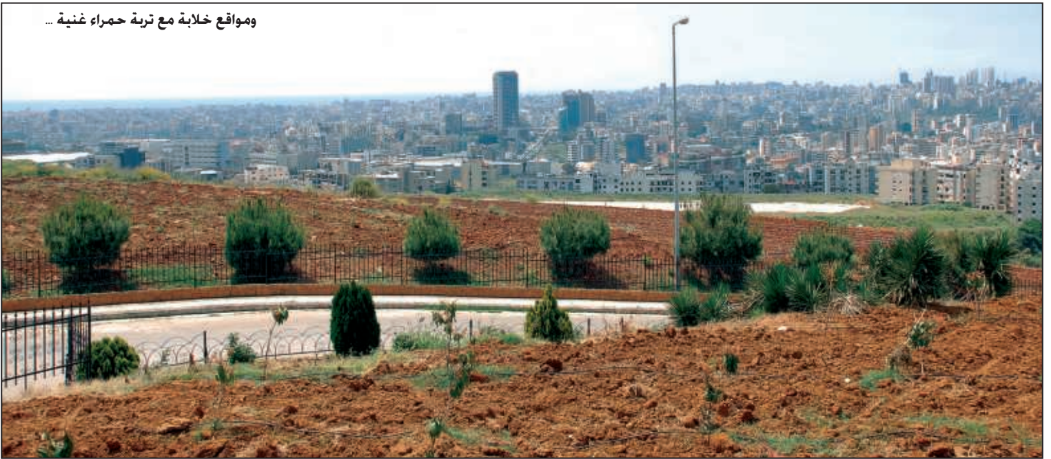
ومواقع خلابة مع تربة حمراء غنية ...