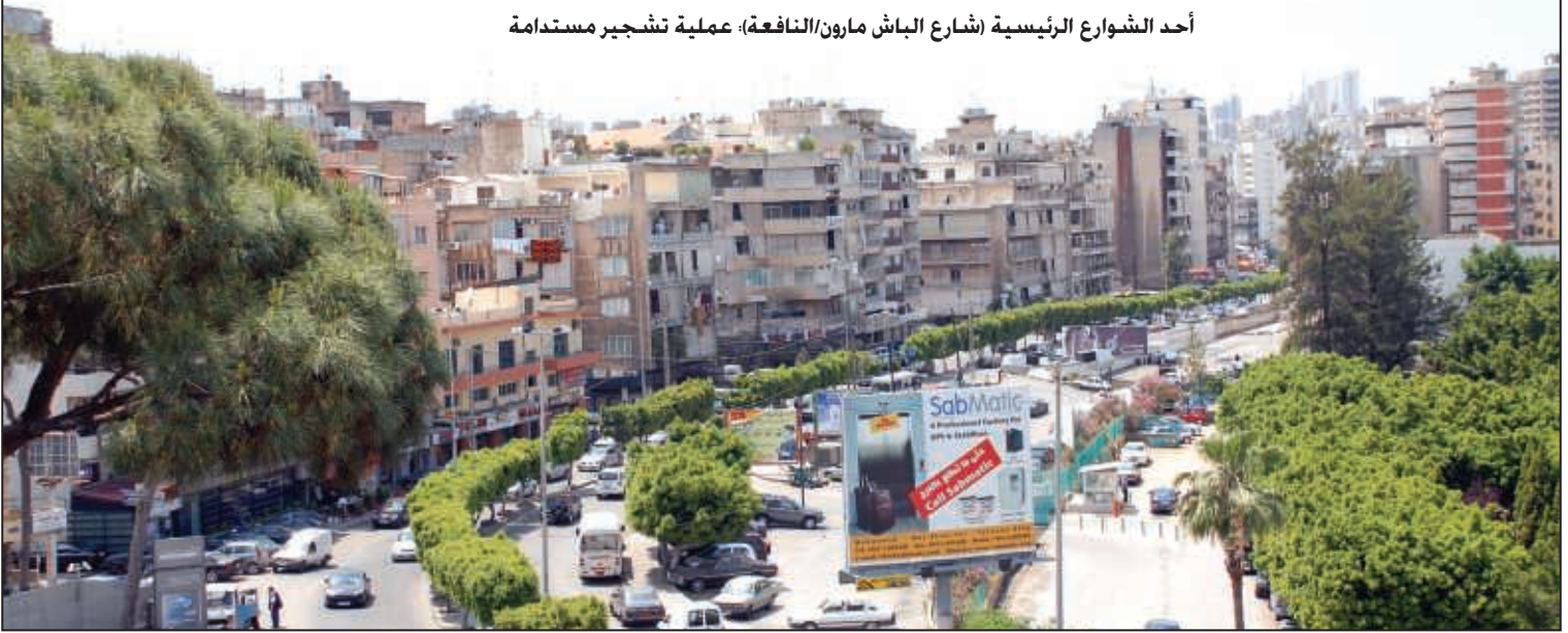
أحد الشوارع الرئيسية (شارع الباش مارون/النافعة): عملية تشجير مستدامة