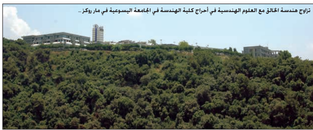
تزاوج هندسة الخالق مع العلوم الهندسية في أحراج كلية الهندسة في الجامعة اليسوعية في مار روكز ...