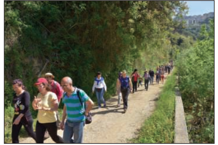
جَنّات حرجية وزراعية ومناخٌ صحي للرياضة البيئية