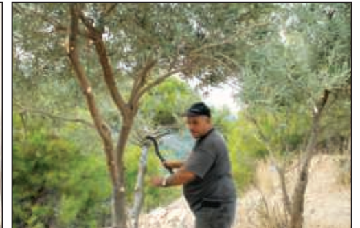
وعمليات صيانة دائمة للأشجار (تشذيب - إقتلاع المتضرر - حماية)