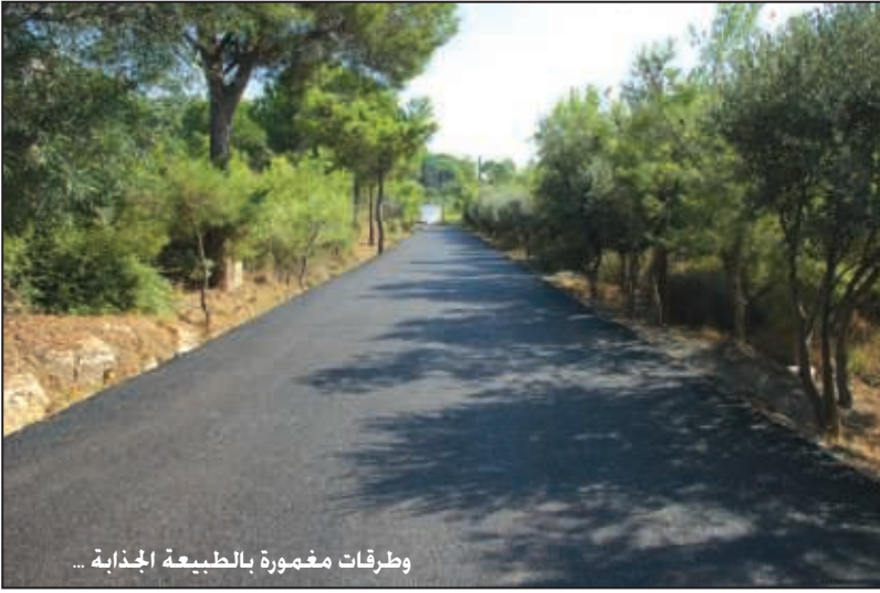
وطرقات مغمورة بالطبيعة الجذابة ...