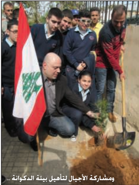
ومشاركة الأجيال لتأهيل بيئة الدكوانة ...

مستشفى أوتيل ديو والمستشفى اللبناني الجعيتاوي ومستشفى القديس جاورجيوس "مستشفى الروم" (الأشرفية) - وغيرها. ومن أبناء الدكوانة عدداً من الأطباء المشهورين في إختصاصاتهم (راجع صفحة ٤٥٢)، كما في جميع الإختصاصات الجامعية.